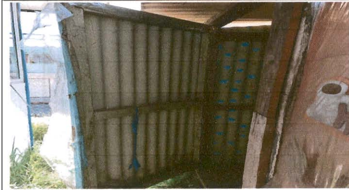
Foto1: Puertas de Servicios sanitarios