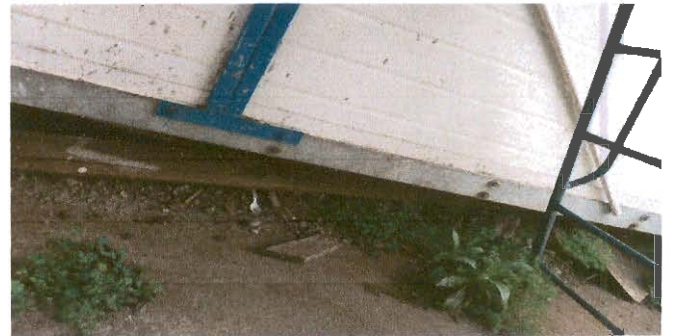
Cierre de superficie abierta de módulos