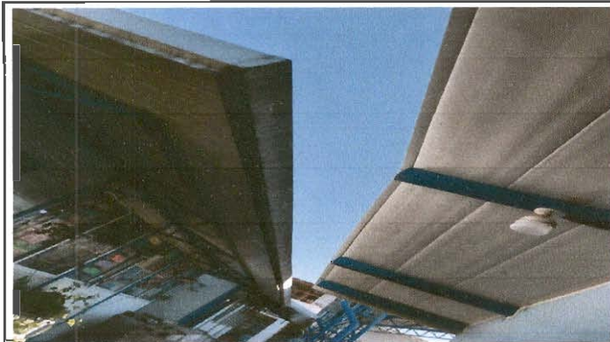
Falta de canales y bajadas de agua