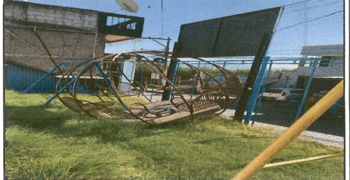
Reparación e instalación de juego

Observación: Si es necesario se pueden agregar hojas adicionales y actualizar el número de hojas